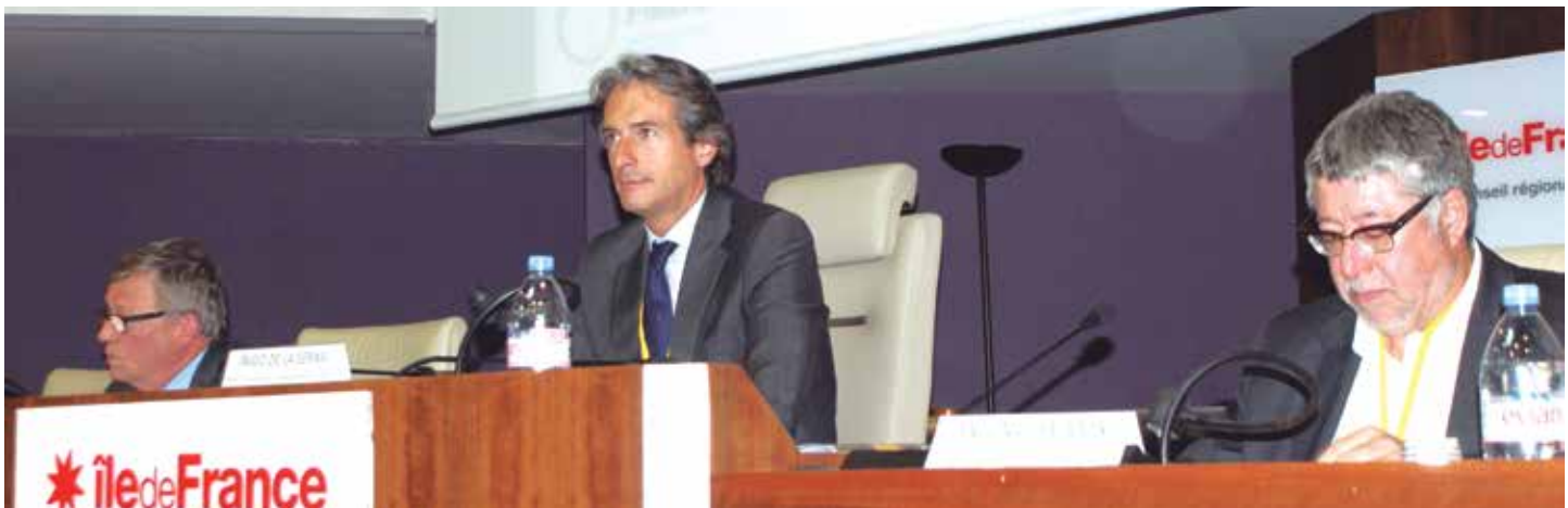
El Presidente de la FEMP durante su intervención en la apertura de la Conferencia celebrada en París.

El Presidente de la FEMP y Alcalde de Santander, Íñigo de la Serna, reivindicó el protagonismo de las ciudades como motores de cambio, de progreso y de innovación, durante su intervención en la conferencia europea que tuvo lugar recientemente en París y en la que intervino en calidad de Vicepresidente del Consejo de Municipios y Regiones de Europa (CMRE).